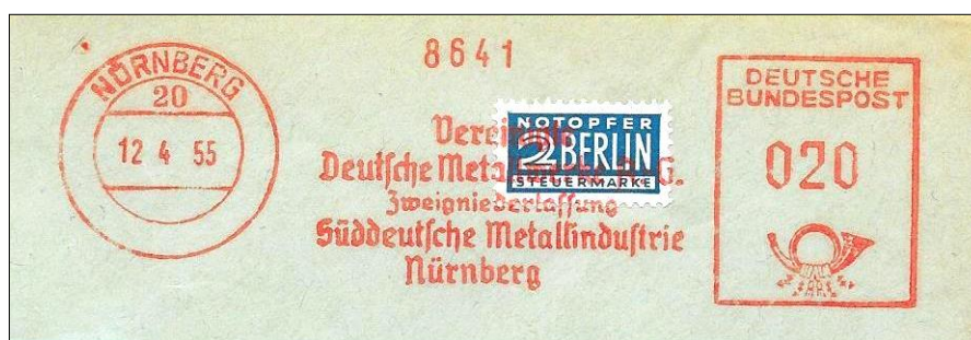
Francotyp model "C" zonder klantnummer (eigen verzameling)

Frankeermachine in gebruik bij "Vereinte Deutsche Metalwerke A.G. - Zweigniederlassung (filiaal) - Süddeutsche Metallindustrie Nürnberg", postkantoornummer 20.