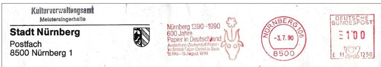
Pitney Bowes "6300" series met klantnummer E 11 1250 (eigen verzameling)

Gebruik van een tijdelijke pub voor de promotie van een tentoonstelling over 600 jaar papier in Duitsland van 19 mei tot 19 augustus 1990 in het Schloss Faber-Castell te Stein.