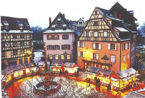
Colmar - Marché de Noël