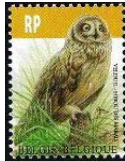
13/02/2012 nr.4218 Velduil