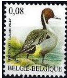
03/01/2011 nr.4091 Pijlstaart