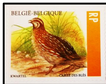
12/06/2023 nr.5172 Kwartel

( de postzegel nr.4091 € 0,08 werd uitgegeven om samen met het nr.4046 € 4,09 het nieuwe RP-recht van € 4,17 te vormen voor de tariefwijziging van 1.1.2011 - namelijk € 4,70 x 8/9 = € 4,17 )