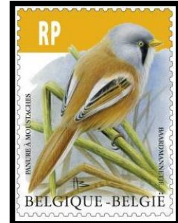
18/03/2019 nr.4858 Baardmannetje

( de postzegel nr.4091 € 0,08 werd uitgegeven om samen met het nr.4046 € 4,09 het nieuwe RP-recht van € 4,17 te vormen voor de tariefwijziging van 1.1.2011 - namelijk € 4,70 x 8/9 = € 4,17 )