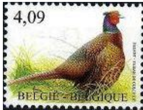
14/06/2010 nr.4046 Fazant

Postzegels uitgegeven voor het RP-tarief vanaf 12 juni 2010